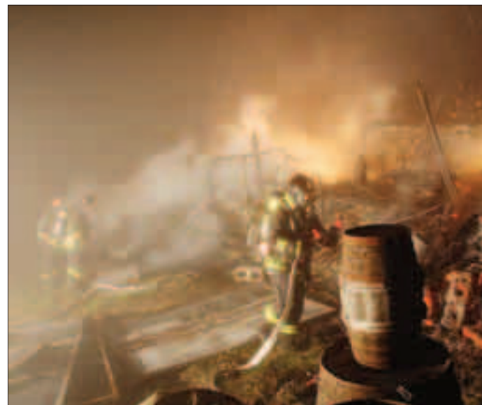
Le operazioni di spegnimento