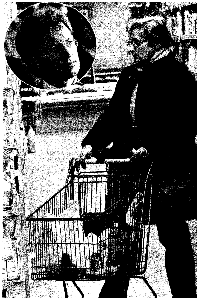
Grande distribuzione Le superfici di vendita sono uno dei temi della riforma

» Innovazione Decisione della giunta. Soddisfatte le categorie