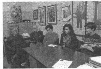
L'incontro dell'Anpi di ieri (Panato)

ha intenzione di chiedere un confronto con il Presidente Dellai, il Rettore Bassi e i Presidi degli istituti superiori con obiettivo la firma di un Protocollo d'intesa per attivare una collaborazione permanente volta a valorizzare i principi della Resistenza e dell'antifascismo tra i più giovani. Una delle prime iniziative proposte dal Circolo Studenti dell'Anpi, in collaborazione con Emergency, è la serata in programma stasera alle 20 al Liceo Rosmini di Trento intitolata "Afganistan: 10 anni di guerra. La medicina come strumento di pace". (m.b.)