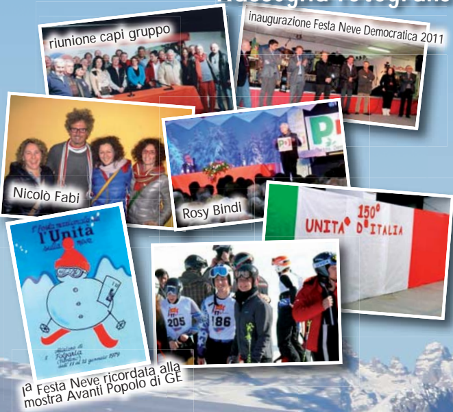
12ª Festa Neve ricordata alla mostra Avanti Popolo di GE