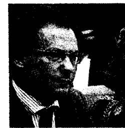
Alessandro Di Battista

« Dobbiamo parlare con tutti i mondi delusi dal berlusconismo e dal populismo leghista