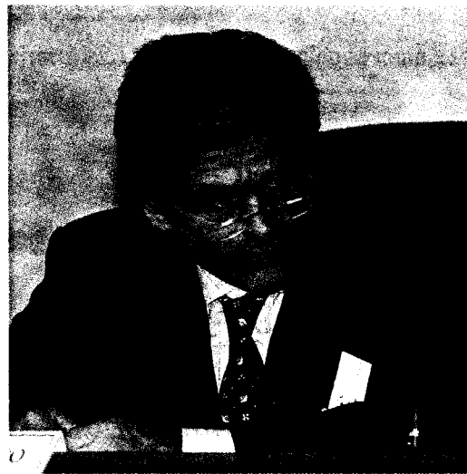
Sergio Chiamparino, ex sindaco di Torino