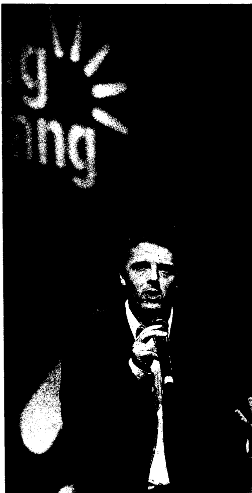
Matteo Renzi sul palco della Leopolda di Firenze

me mi piace la sua attenzione a tenere le porte aperte a tutta la coalizione cercando il dialogo. Ecco, da qui si deve ripartire. A Firenze non c'erano quattro scalmanati, ma giovani che chiedono spazio per dire la loro. E' un fermento im-